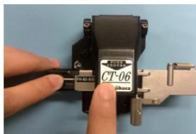
1. 光ファイバ口出処理