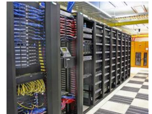
輻輳改善 前 → 後