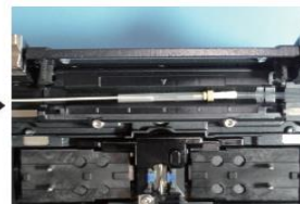
3. 融着接続部の補強